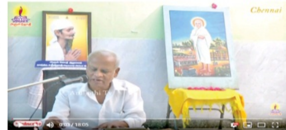
#vattalar #Aruljothi திருபானந்த சுவாமிகள் ஏன் ஞானசபையை விட்டு சென்றார்? Thiru.Umapathi Ayya 7,120 views • Aug 31, 2019