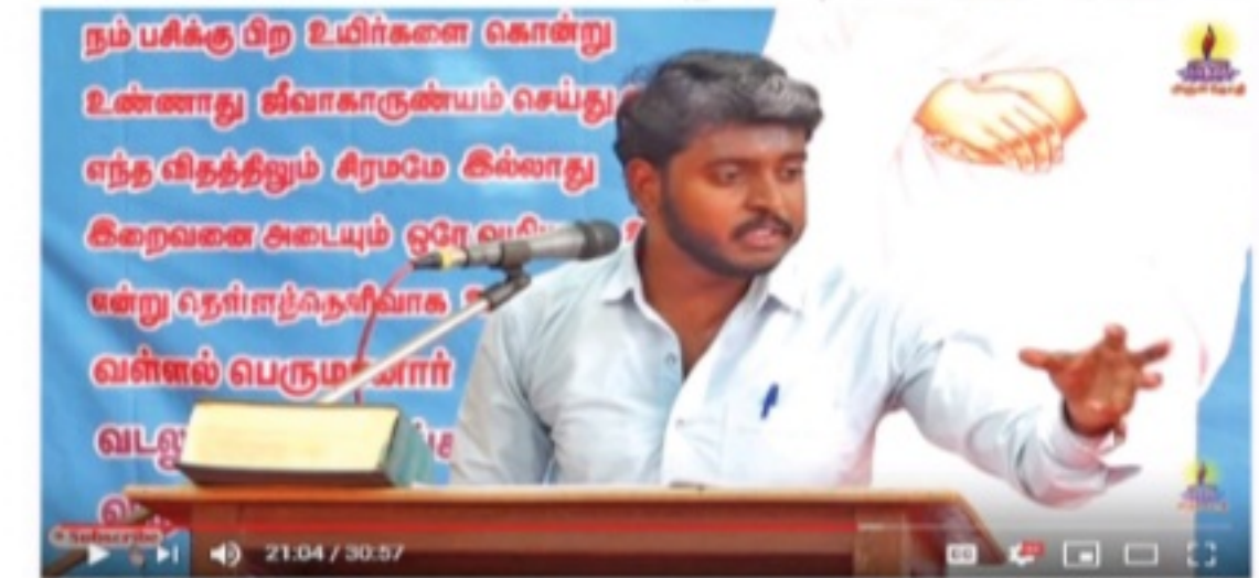
#vattalar #Aruljothi வள்ளலார் வழி நடந்தால் வருகின்ற வளங்கள்/Thiru.Saravanan ayya/Part-1 10,889 views • Oct 8, 2019

அருள்ஜோதி தொலைக்காட்சியில் ஒளிப்பரப்பான நிகழ்ச்சிகளை Internet UTube மூலம் காணலாம்.