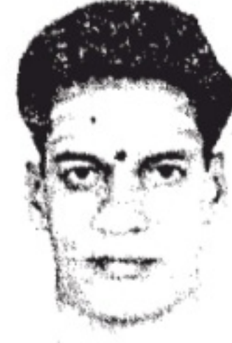
திருவாசக செந்நாவலர் திருமயிலை ஒதுவார்