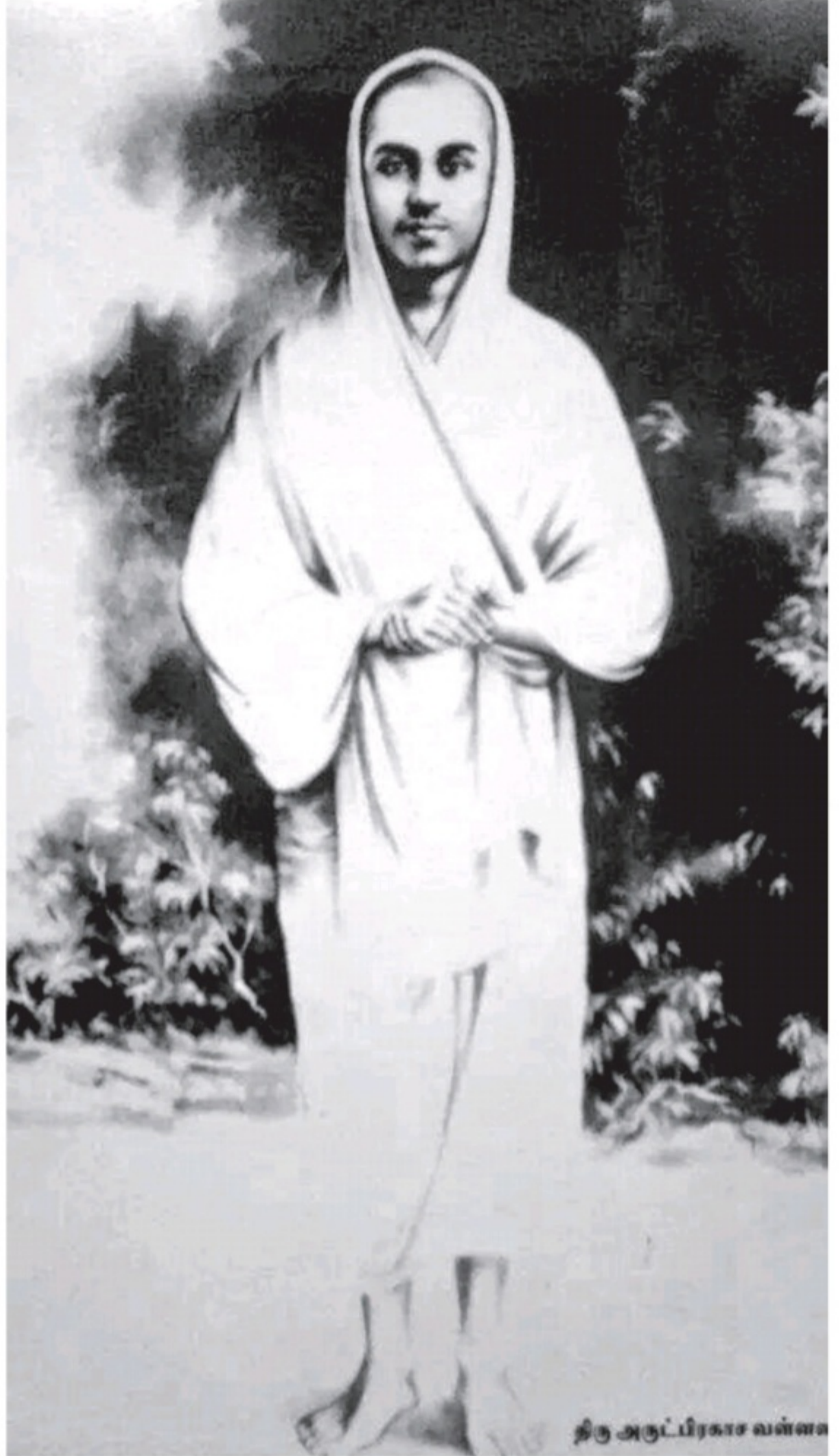
திரு அருட்பிரகாச வள்ளல்

அறியாமைதான் மக்களின் துன்பத்திற்கு காரணமாகிறது. இதை போக்குவதே இதனை கருதிய வள்ளலார். இறைவன் ஒருவனே அவன் அருட்பெருஞ்ஜோதியானவன். அத்துடன் ஒன்றே குலம் ஒருவனே தேவன் எல்லா உயிர்களும்