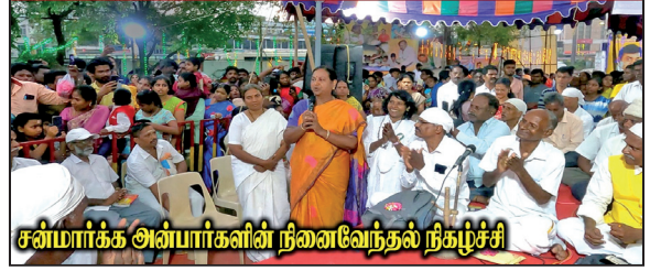
சன்மார்க்க அவர்களின் நினைவேந்தல் நிகழ்ச்சி