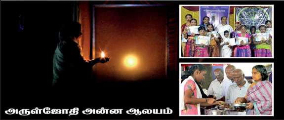
அருள்ஜோதி அின்ன ஆலயம்