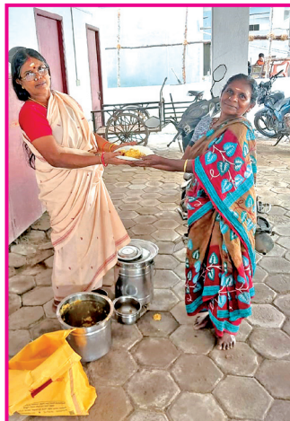
செல்வம் திலகம் பள்ளிக்கரணை